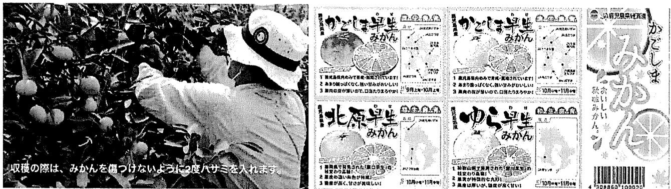
収穫の際は、みかんを傷つけないように2度ハサミを入れます。